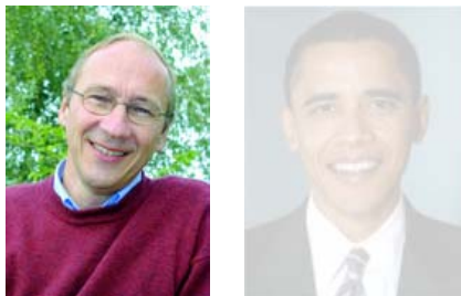
Inge Eidsvåg & Barack Obama